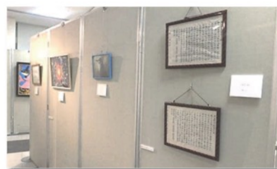
書道や写真作品もあります。